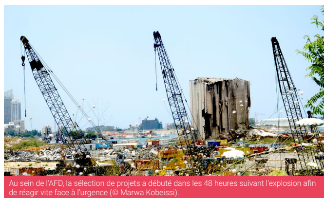
Au sein de l'AFD, la sélection de projets a débuté dans les 48 heures suivant l'explosion afin de réagir vite face à l'urgence.